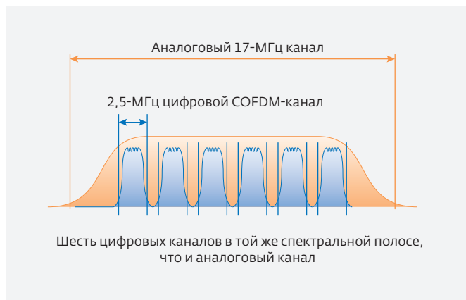
Рис.3. Спектральные полосы сигналов с аналоговой частотной модуляцией и COFDM

Фирма Silvus Technologies выпускает также MIMO-репитер SC3800, отличающийся расширенным диапазоном рабочих частот (400–2400 МГц и 4–6 ГГц) с возможностью использования ширины каналов 1,25, 2,5, 5, 10 и 20 МГц [20].