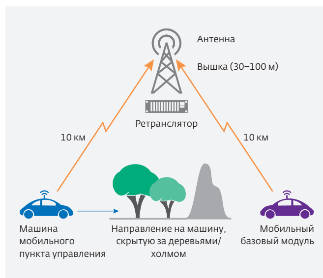
Рис.2. Принцип взаимодействия элементов в составе комплекса UGV

Сегодня для решения этой проблемы широко применяют сигналы COFDM. Идея использования COFDM в каналах связи UGV не нова. Она рассматривалась, например, в патентах США на изобретение, заявленных в 2006–2007 годах. Так, в патенте США №7633852 [16] указано, что применение COFDM для связи с UGV с полосой канала 2,5 МГц и 400 информационными поднесущими позволяет получить ту же пропускную способность, какую обеспечивает