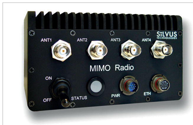
Рис.4. MIMO-репитер SC3500 фирмы Silvus Technologies