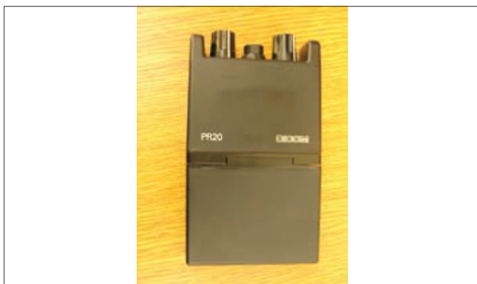
Рис. 2. Устройство персональной радиосвязи PR-20 компании DICOM

вании несущей частоты в районе 300 МГц, в то время как известные публикации по вопросам развития ММО-технологий относились преимущественно к более высокочастотным диапазонам (например, 2 и 5 ГГц). По мнению докладчика, для тактической военной связи диапазон 300 МГц довольно привлекателен благодаря "мягким" характеристикам распространения радиоволн, которые в этой полосе могут легко огибать препятствия. Кроме того, частота несущей 300 МГц еще достаточно высока, чтобы ММО-терминалы с антенными решетками были сравнительно компактны для размещения на боевых машинах и других подвижных средствах. Описанный в докладе эксперимент проводился с OFDM-сигналом общей полосой 20 МГц. Качество связи в городской застройке исследовалось в диапазоне расстояний "передатчик – приемник" до 250 м. При этом использовались 7-элементные кольцевые антенные решетки из вертикальных вибраторов на передачу и прием сигналов. В ходе испытаний стабильно наблюдалось увеличение в 4–6 раз емкости канала связи в сравнении с одноантенными решениями. Теоретически же при некоррелированных трассах распространения сигналов должен был быть семикратный выигрыш. В докладе также сделан акцент на том, что канальная емкость исследуемой системы ММО